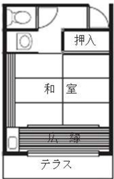
Cタイプ 22.9㎡ 76,600 円/月